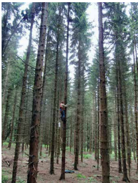
Abb. 5: Brutrevier mit Besteigung des Horstbaumes

Bei Untersuchungen am Sperber in Nordrhein-Westfalen wurde eine deutliche Verschiebung vom Nadelholz- zum Laubholzbrüter beobachtet (C. SANDKE und T. STANKO, mündliche Mitteilung), außerdem brütete die Art dort vermehrt