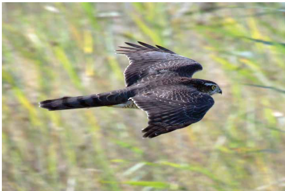
Abb. 6: Flugbild des Sperberweibchens

in Hecken, an Straßenböschungen, auf Friedhöfen und in Parkanlagen. Entsprechende Verhaltensweisen konnten in unserem Untersuchungsgebiet noch nicht nachgewiesen werden, trotz gezielter winterlicher Begehungen in potentiellen Laub- und Mischwaldbeständen.