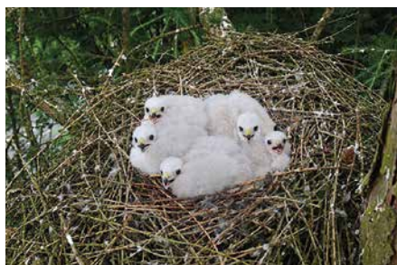
Abb. 2: Sperberhorst

gangenen Jahren als Brutbaum für den Sperber wesentlich an Bedeutung gewonnen. Nach Nordwesten hin weist das Untersuchungsgebiet verstärkt offene Strukturen auf, welche sich vorzüglich als Jagdgebiete eignen. Hier gehören Heckenstreifen, Feldgehölze, Vorgärten und Tierweiden zum Landschaftsbild.