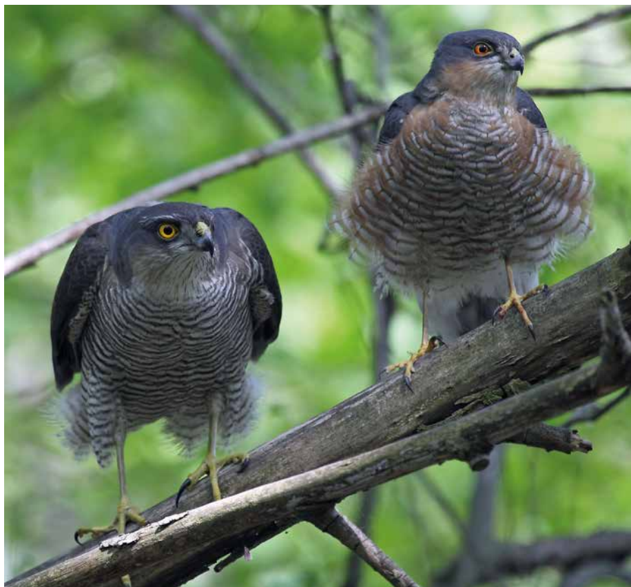
Abb. 1: Sperberweibchen (links) und -männchen

Wir beschäftigen uns seit nunmehr fast 30 Jahren mit dem Sperber ( Accipiter nisus , Abb. 1) in Nordhessen. Im Anschluss an eine fünfjährige Einarbeitungsphase von 1990 bis 1994, die direkt an eine frühere Untersuchung (SCHNEIDER et al. 1996) anschloss, starteten wir im Jahr 1995 eine langfristig angelegte Studie zur Siedlungsdichte und Brutbiologie des Sperbers. Das Untersuchungsgebiet liegt direkt westlich der Großstadt Kassel und erstreckt sich mit einer Fläche von 230 km 2 über die Landkreise Kassel und Schwalm-Eder. Die Grenzen des Gebietes sind die Ortschaften Zierenberg-Oberelsungen im Nordwesten, Ahnatal-Heckershausen im Nordosten, Naumburg-Elbenberg im Südwesten und Baunatal-Hertingshausen im Südosten. Mit ca. 15 % Siedlungsfläche, 35 % landwirtschaftlicher Nutzfläche und 50 % Waldanteil entspricht die Flächennutzung der räumlichen Gliederung Nordhessens. Das Gebiet liegt zwischen 220 m (Hertingshausen) und 615 m über NN (Hohes Gras/Essigberg). Über die Fläche erstrecken sich gleichmäßig dörfliche Siedlungen. Das Gebiet schließt sechs größere Waldkomplexe ein, in denen die Buche