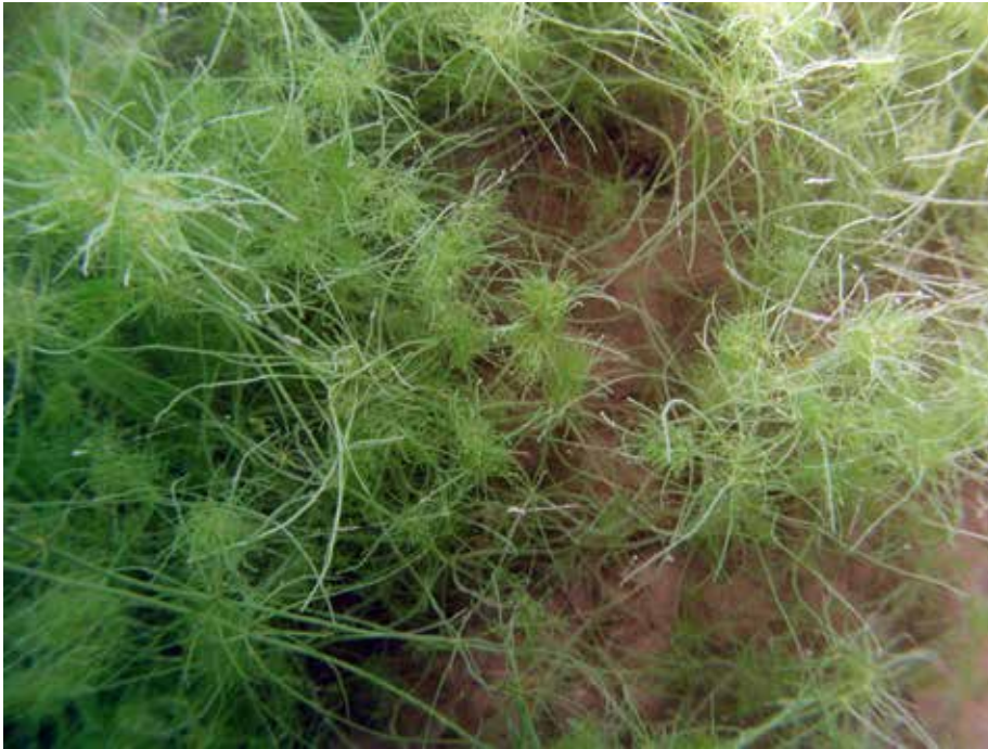
Abb. 2: Verworrene Baumleuchteralge ( Tolypella intricata )

nach KRAUSE (1997) vorwiegend Flachwasser und ist auch in Torfstichen, Lehmgruben und Gräben anzutreffen. Aus Hessen gab es bisher nur einen nicht nachprüfbaren Nachweis aus dem 19. Jahrhundert. Die aktuellen Nachweise aus dem Weilerhofer See bei Wolfkehlen, dem Riedsee bei Leeheim und einer Kiesgrube in der Hammaue (KORTE & GREGOR 2008) zeigen, dass sie gerne Abgrabungsgewässer bewohnt. Man trifft N. tenuissima selten in mehr als 5 m Tiefe