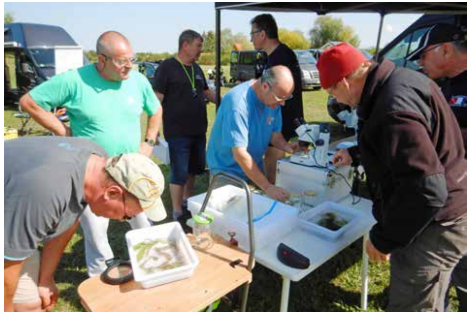
Abb. 1: Felduntersuchung am Riedsee in Biblis, September 2019

Das Gesamtarteninventar der hessischen Wasserpflanzen ist mittlerweile gut be-