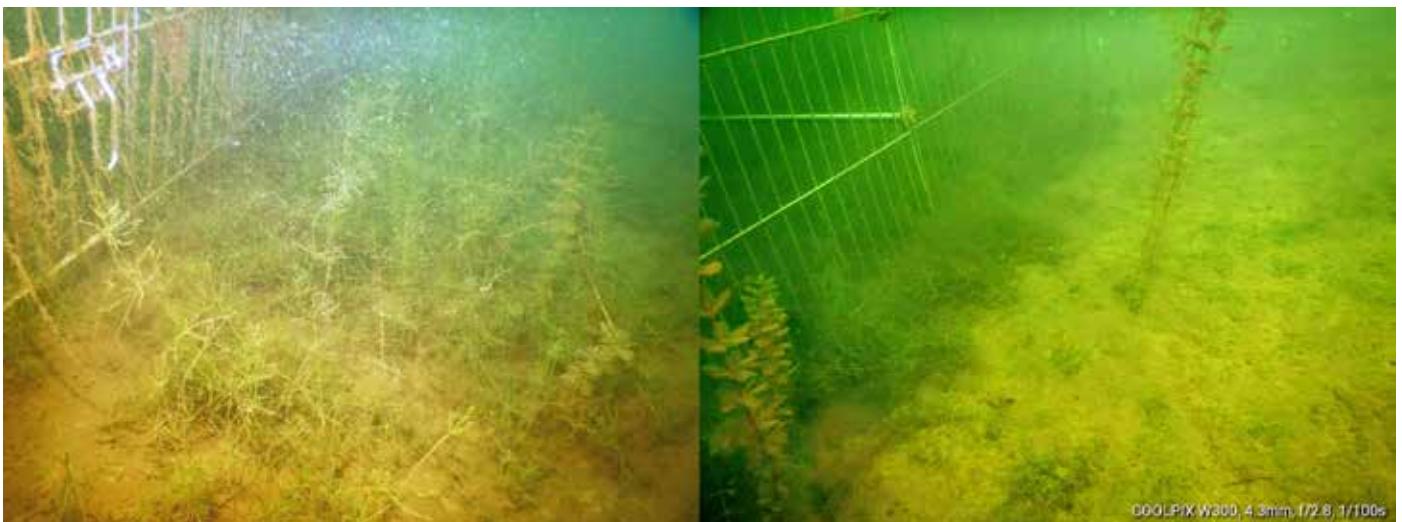
Abb. 3: Wühlschäden am Enclosure Nord in Niederweimar. Das linke Foto wurde am 10.6.2019 aufgenommen, das rechte am 17.8.2019.

Bei vielen Tauchgängen konnten Beeinträchtigungen in der Vegetationsstruktur festgestellt werden (Abb. 3). Diese können durch einen unsachgemäßen Fischbesatz hervorgerufen werden. Verantwortlich für solche Beeinträchtigungen sind meistens Karpfen oder Brachsen, zwei vornehmlich am Bodengrund fressende Fischarten (benthivore Ernährung). Beide Arten kommen ursprünglich in Altarmen und Altwässern großer Flussauen oder natürlichen Seen vor. In der Regel sind diese Gewässer nährstoffreich (eutroph) und die aquatische Vegetation an diese Arten angepasst. In