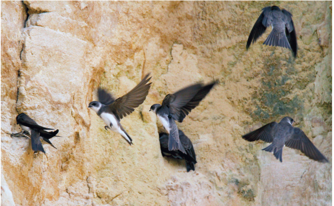
Abb. 1: Uferschwalben vor ihren Brutröhren an einer Sandsteilwand