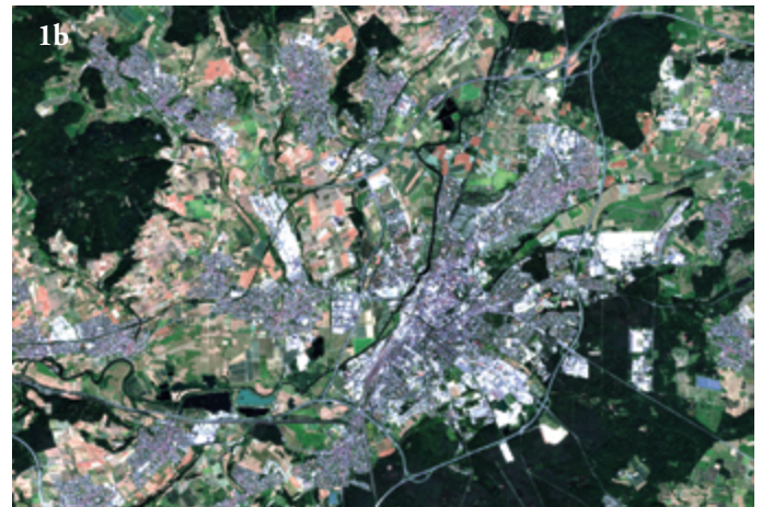
Abb. 1a – d: Aufnahme des Sentinel-2-Satelliten der Stadt Gießen und Umgebung in Hessen am 29.6.2019.

1a: Lage des Ausschnitts der Aufnahme des Sentinel-2-Satelliten in Hessen rot umrandet dargestellt (Datengrundlage: HLNUG, Kartenhintergrund: HVBG)