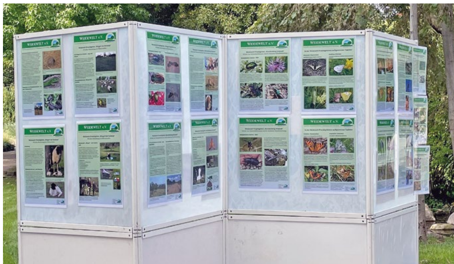
Abb. 1: Weidewelt-Infotafeln auf der Spätsommerschau 2021 im Palmengarten Frankfurt

Um zitierfähige Broschüren erstellen zu können (z. B. zur jeweiligen „Weidelandchaft des Jahres“, siehe unten), ist eine „International Standard Book Number“ (ISBN, deutsch: Internationale Standardbuchnummer) unerlässlich. Mit einer ISBN-Nummer kann man jedes Buch weltweit eindeutig identifizieren und