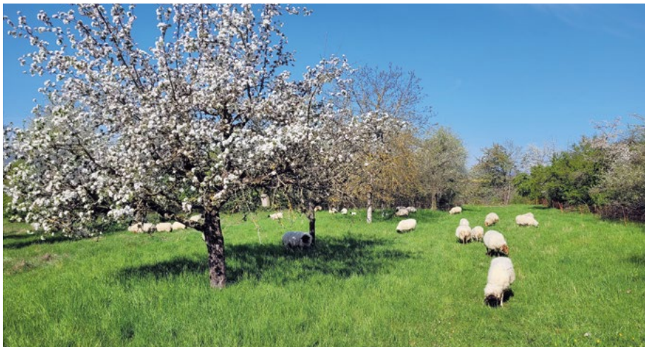
Abb. 7: Blühende Obstbäume und Schafbeweidung im Projektgebiet „Wingert bei Dorheim

nen-, 605 Käfer-, 105 Schmetterlings-, 133 Hautflügler-, 63 Wanzen-, 20 Heuschrecken-, 6 Amphibien- und Reptilien-, 104 Vogel- und 26 Säugetierarten. Die Untersuchungen laufen weiter, noch nicht alle Tiergruppen sind bestimmt. Weiterhin beteiligt sich Weidewelt z. B. an faunistischen Begleituntersuchungen von Blühstreifen und Blühflächen, die heute in Politik und Verwaltung, aber auch in der Bevölkerung und bei Landwirten als „Allheilmittel“ gegen den Biodiversitätsverlust angesehen und angelegt werden. Erste Ergebnisse sind, was den ökologischen Nutzen angeht, eher ernüchternd.