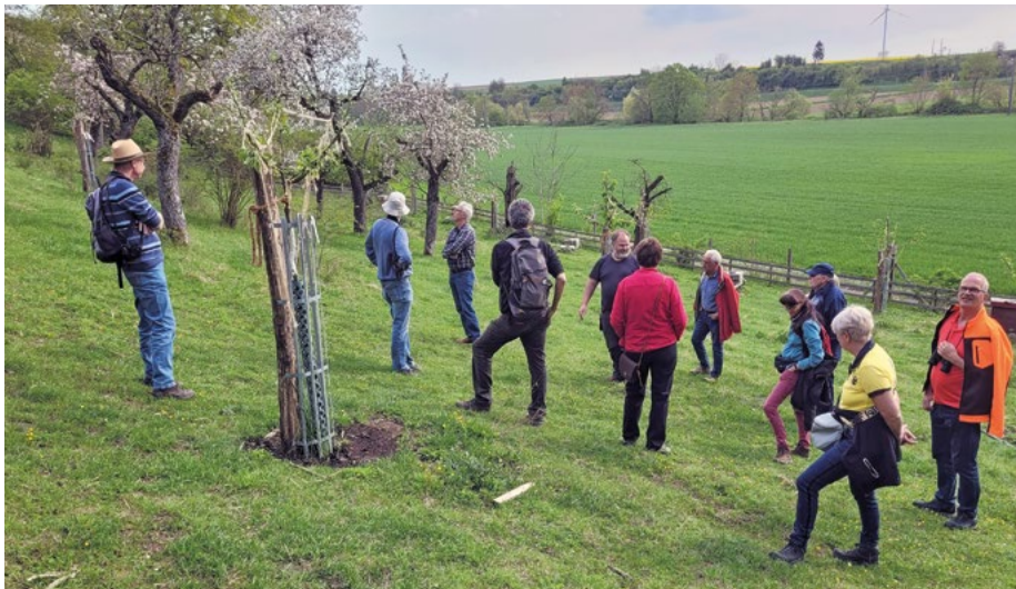
Abb. 2: Exkursion 2022 in ein entbuschtes und mit Schafen beweidetes Streuobstgebiet