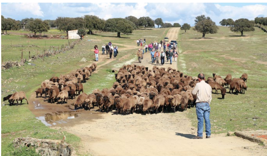
Abb. 3: Im Jahr 2018 wurde von „Weidewelt-Reisen“ für die GEH eine Fachexkursion zu Weidelandschaften und bedrohten Nutztierassen in den Westen Spaniens mit-organisiert, an der 60 Personen teilnahmen.