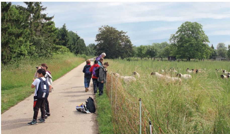
Abb. 5: Besuch bei Schafen im Rahmen einer Schul-Projektwoche